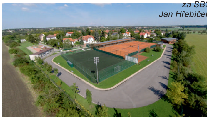
za SB2 Jan Hřebíček

Těšíme se zejména na vaši fyzickou návštěvu!!!