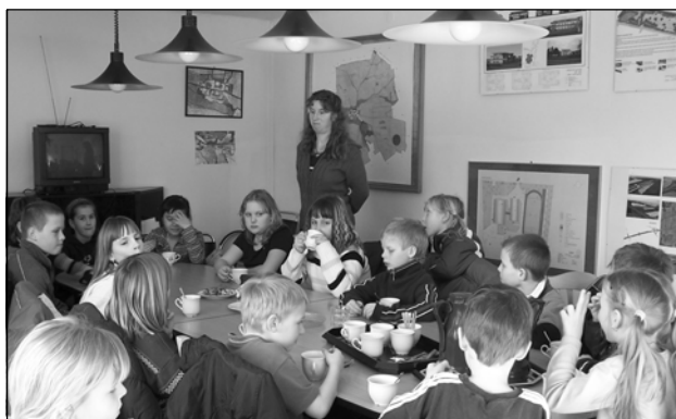
V malé zasedací síni čekalo na žáky malé občerstvení