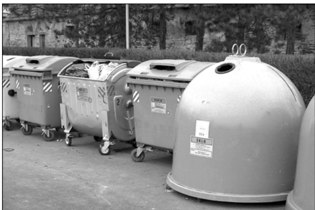
Často můžeme vidět v kontejneru na papíry i domovní odpad