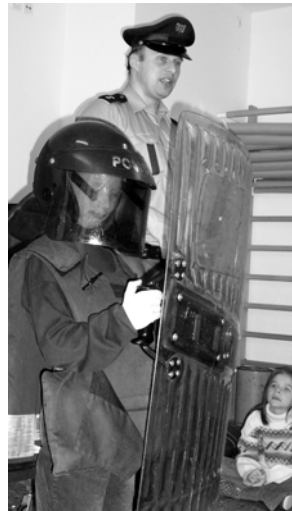
Z preventivní přednášky Policie ČR v ZŠ Praha-Běchovice.