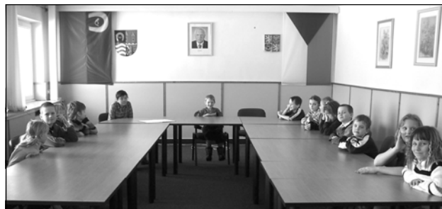
Na několik minut si děti vyzkoušely práci zastupitelů