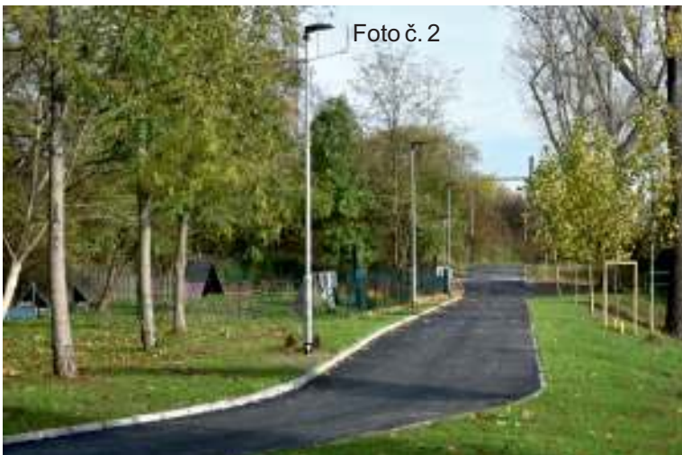
Foto č. 2

Součástí investice byla i úprava místní vodoteče. Dláždění koryta bylo na přání MHMP prodlouženo o cca 10 m.