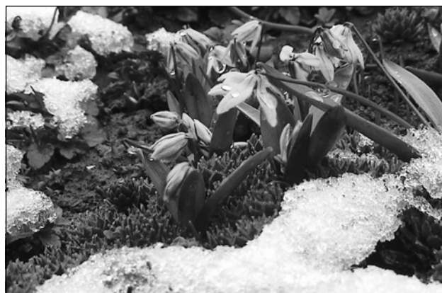
První jarní den. Kdo by letos čekal, že ladoňky na zahrádce zapadnou sněhem.