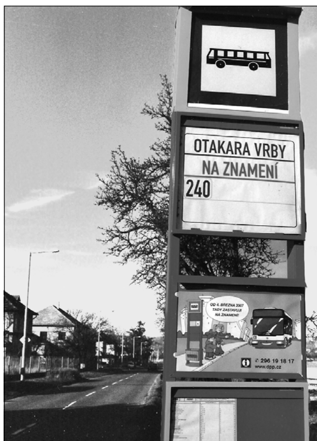
Zastávky jsou již v provozu, a přestože na znamení, jsou místními občany hojně využívány.