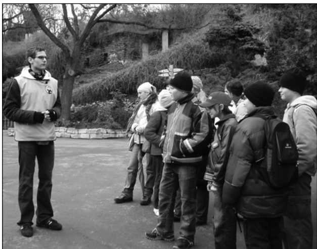
Výuka v zoo Praha byla pro šestáky poučná a velmi zajímavá.

Jako zbraň dokáže využít i ocas. Na www.zoopraha.cz jsou o něm uvedeny ještě tyto zajímavosti: Mláďata žijí v prvních měsících na stromech a živí se hlavně ptáky. Asi v roce sestupují na zem a pozvolna mění zbarvení na šedavé. Varani jsou aktivní ve dne, jen nejteplejší hodiny tráví odpočinkem ve stínu nebo v podzemní noře. Jejich hlavní potravou jsou zdechliny, které ucítí až na vzdálenost pěti km. Jsou však také zdatnými lovci a při pronásledování kořisti vyvinou rychlost až 18 km/h. I když kořist hned neusmrtí, je jejich kousnutí obvykle smrtelné, protože živočich uhynie na otravu krve způsobenou mnoha bakteriemi, které žijí v tlamě varanů. Dnes žijí varani jen na zlomku původního území a jsou přísně chráněni. Z Indonésie je možné vyvézt varany jen jako dar tamní vlády. A kde ho v pražské zoo najdete? V pavilonu Indonéská džungle.