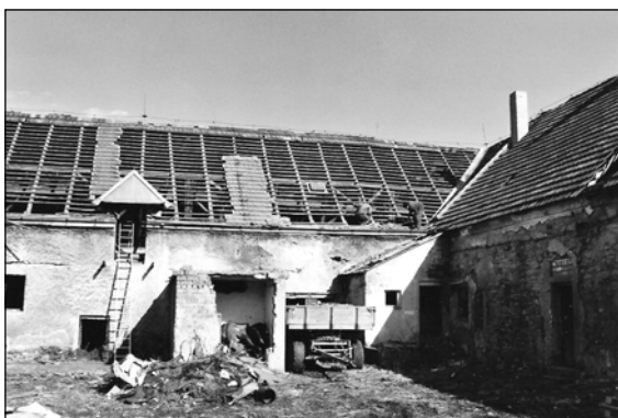
Tyto snímky již patří minulosti.

Centrum obce se během příznivých klimatických podmínek v měsíci březnu začalo proměňovat. Kolem spodního statku nejprve zmizely stromy a keře. Později začaly mizet tašky, krovy, štíty a zanedlouho už budou o původním stavu vyprávět jen tyto fotografie. Až bude na místě statku stát nová budova úřadu, bytovky, podzemní garáže a obchůdky, málokdo uvěří, jak nehostinné místo to bylo na jaře v roce 2007. Protože práce budou probíhat intenzivně i v následujícím období, upozorňujeme občany, aby z bezpečnostních důvodů nevcházeli do prostoru, kde probíhají demoliční práce.