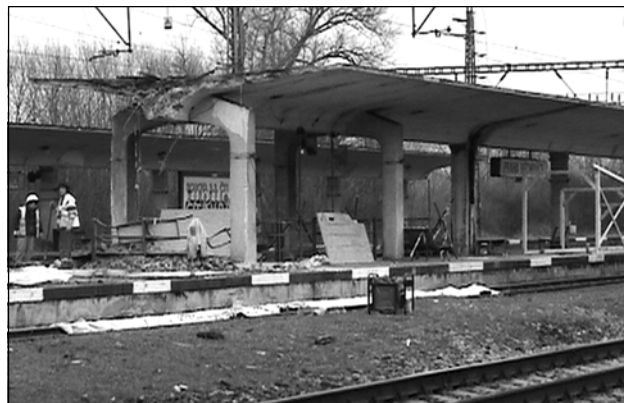
Nádraží Praha-Běchovice se dočká značných změn. K těm nejvíce viditelným patří v současné době likvidace nástupišť, jejich prodloužení a nové zastřešení.

Rybí tuk obsahuje skupinu nenasycených mastných kyselin, nazývajících se omega-3. Dvě neúčinnější formy omega-3 nenasycených kyselin živočišného původu je EPA (kyselina eikosapentanová) a DHA (ky-