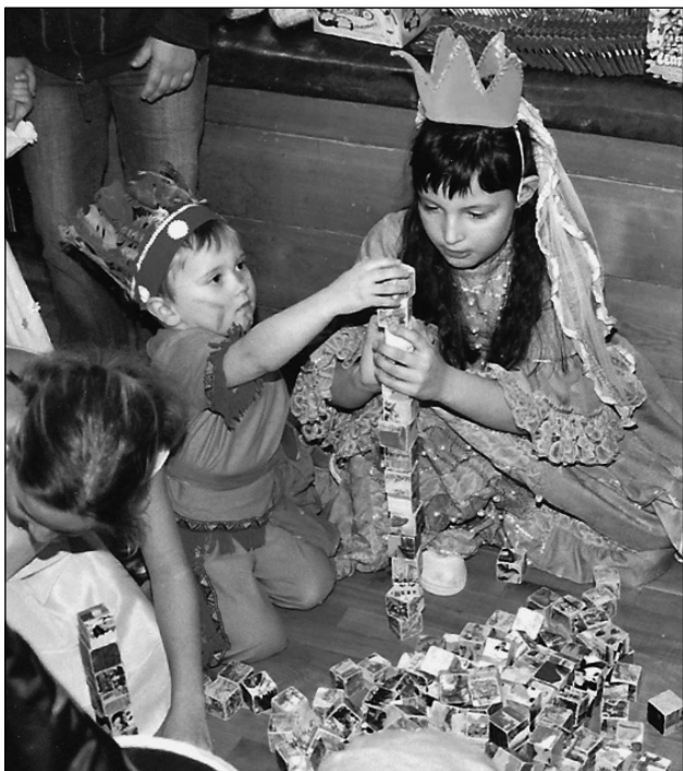
Princezna s indiánem byla jedna z dvojic, které se pokoušely postavit nejvyšší komín.

I když letošní zima připomínala všechno možné, jen ne zimu, tradičním zimním radovánkám – plesům a karnevalům jsme se nevyhnuli. Přestože u nás není vhodný sál na klasický bál, ten dětský má u nás tradici. A tak se v neděli 4. března sešli ve Sportovním centru