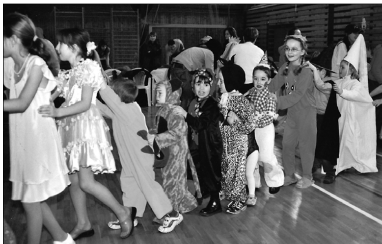
Do vláčku za lokomotivu se zapojily všechny masky, které byly v sále.

Celé odpoledne měly možnost děti nejen tancovat, ale také soutěžit. Ti malí krmili lva, chodili na chůdách nebo stavěli z kostek komíny. Tradiční židlovaná byla nahrazena z bezpečnostních důvodů polštářkovou. Boj o polštářky byl ale stejně nelítostný. Během odpoledne čekalo na přítomné předtančení skupiny Sweet, která pak předvedla zájemcům několik tanečních kroků. Ne všem se dařilo napodobit secvičená děvčata, a tak přivítali rozjíždějící se mašinku, která nabírala za sebe vagónky. Přitom měla porota velkou práci vybrat z nepřeberného množství masek ty nejlepší a předat jim odměny. Vůbec není rozhodující zda vyhrál čmeláček, princezna, beruška, tygřík, indián, pavouk nebo Bořek Stavitel. Všichni dostali odměnu, kterou věnoval ÚMČ Praha-Běchovice a Sokol Běchovice.