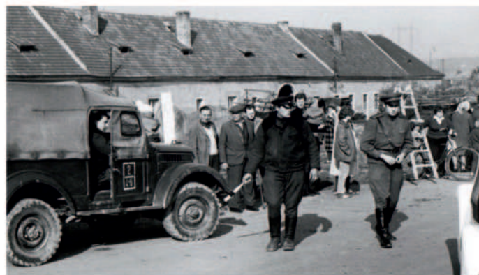
Nebylo příjemné vysvětlovat okupačním vojákům v roce 1968 proč je pořadatelé nemohou pustit na silnici.

To jsou jen některé úryvky z dobových článků, které se věnovaly pravidelně Mladým Běchovicím. Téměř každý rok se našla po závodech v některém tištěném periodiku zmínka o Běchovicích. Redaktoři vypisovali vítěze a snažili se čtenářům přiblížit atmosféru kolem závodu.