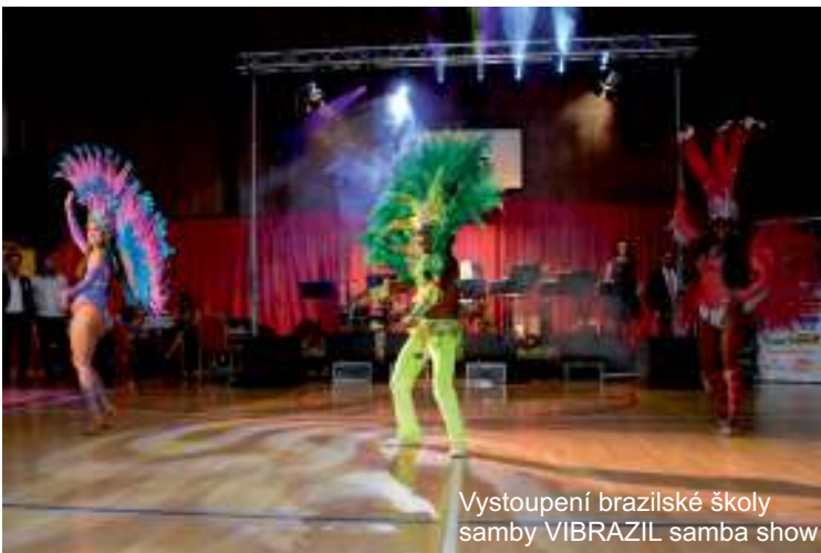
Vystoupení brazilské školy samby VIBRAZIL samba show