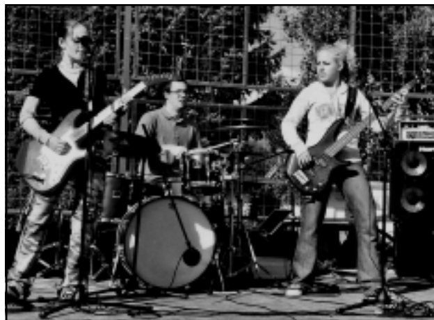
Vystoupení skupiny K2 doprovázel „vypůjčený“ bubeník.

S děvčaty se můžeme setkat na festivalech, ale také v Bulharsku, Polsku nebo Německu. Ano, tato skupina svými písničkami dělá radost snad celé Evropě. Škoda, že v Běchovicích se nenašlo dostatečné množství