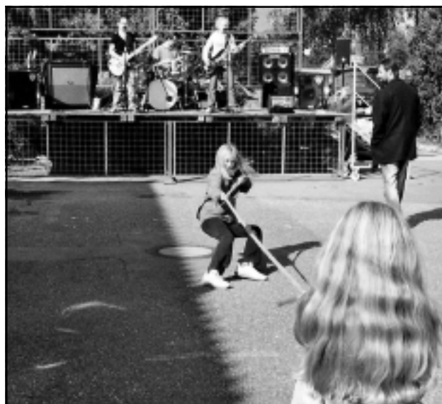
Za doprovodu skupiny K2 probíhaly různé soutěže o ceny.