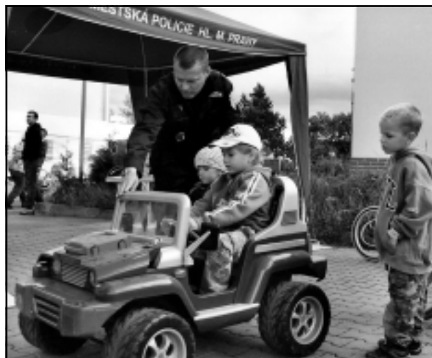
Akumulátorová autíčka přitahovala kluky i holčičky.