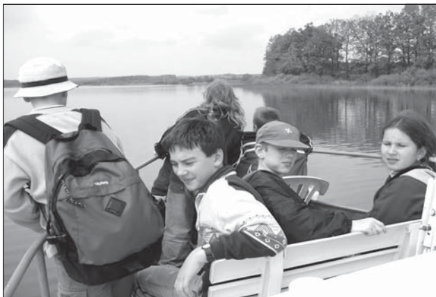
Cesta na lodi kolem rybníku Svět byla pro výletníky zajímavá.

Prohlédli jsme si město, navštívili rožmberské interiéry zámku, kde děti nejvíce zaujalo dobové nádobí, zbraně, terče a brnění. Dověděly se mnoho zajímavostí, které v dějepisu ještě neprobíraly. Velmi pěkná byla expozice ve sklepení „STRAŠIDLA ZEMÍ KORU-