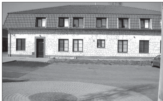
Popraskaná fasáda byla důvodem k její opravě