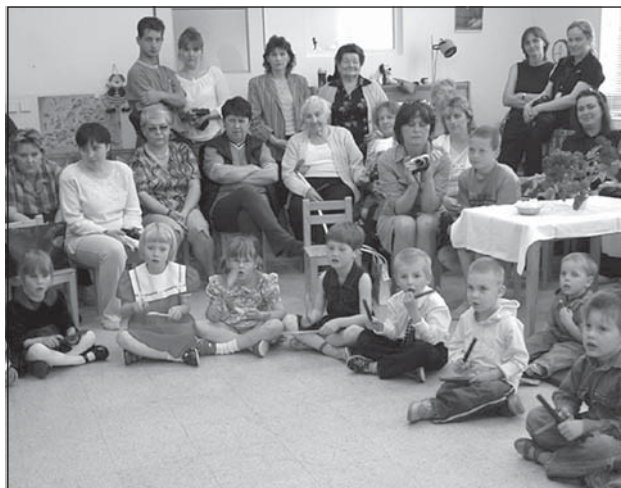
Milé vystoupení žáčků z mateřské školy při příležitosti oslavy Dne matek.