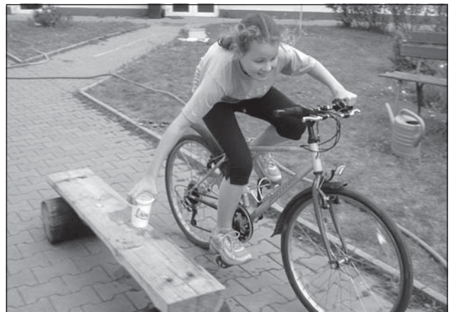
Jízda zručnosti byla sice náročná, ale všichni se na ni těšili.