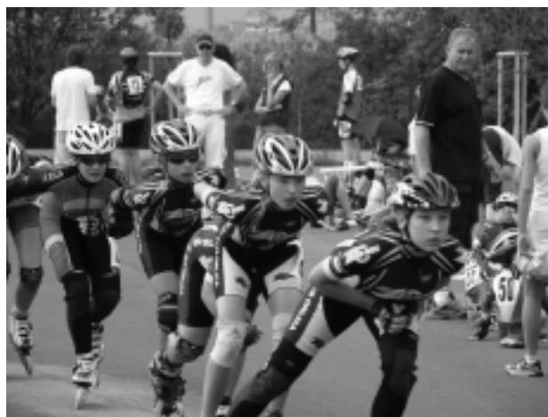
Vytrvalostní závody se společnými starty byly divácky velmi zajímavé.