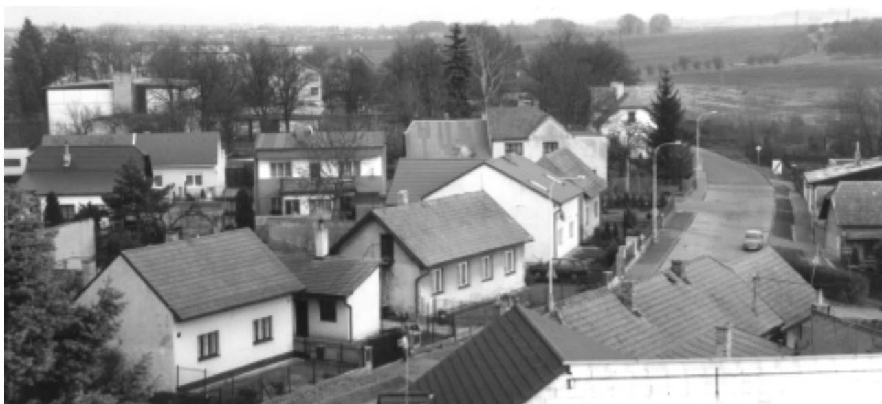
Běchovice z ptačí perspektivy. Ulice Ke Kolodějům se v poslední době sklidnila. Dotknou se i této části obce plánované změny?