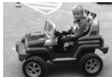
Nejoblíbenější atrakcí byla v loňském roce slalomová jízda na elektrickém autíčku.

Jako minulý rok zde mohou děti pod vedením Policie hlavního města Prahy změřit své síly a zhodnotit své dovednosti v jízdě na elektrických motorkách, koloběžkách a kolech. Dívčí hudební skupina „K2“ představí nové písničky při živém koncertu. Taneční skupinou Sweet zajišťuje kulturní vložku a na své si přijdou i milovníci tomboly a soutěžení. Spousta dobrot a cen, čeká na ty, kteří 9. září nebudou líní a vyrazí si vychutnat nedělní akci Haló škola volá.